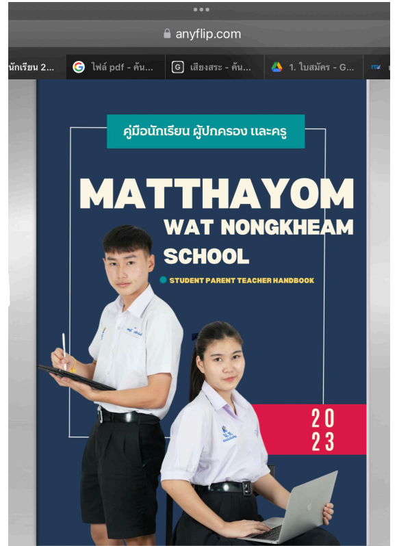
คู่มือนักเรียน 2566 โรงเรียนมัธยมวัดหนองแขม คู่มือนักเรียน 2566 โรงเรียนมัธยมวัดหนองแขม